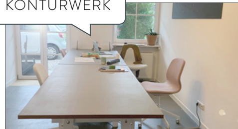
Blick von vorne nach hinten

merlein können hier Ideen wachsen, erprobt und mit anderen besprochen werden. Ist ein kreativer Impuls oder eine zweite Meinung gefragt, findet sich meist ein*e Sparringspartner*in – alternativ kann immer ein guter Espresso helfen.