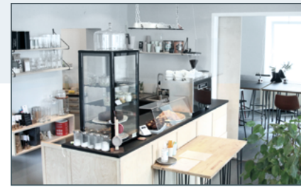
Blick vom Café ins Coworking

merlein können hier Ideen wachsen, erprobt und mit anderen besprochen werden. Ist ein kreativer Impuls oder eine zweite Meinung gefragt, findet sich meist ein*e Sparringspartner*in – alternativ kann immer ein guter Espresso helfen.